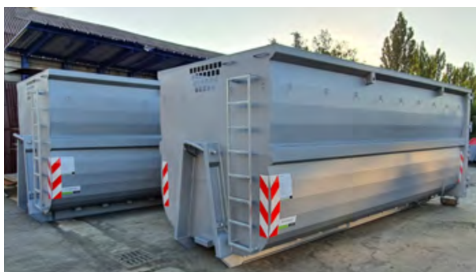
ABR-HBI objem 36 m 3