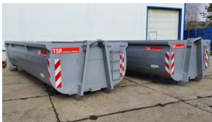
ABR-HBI objem 18 m 3